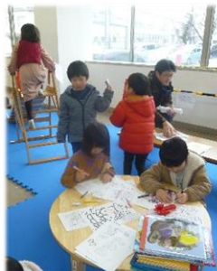
「遊び広場」でぬり絵