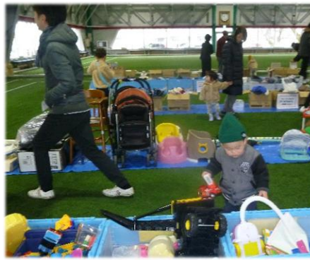
「これ、ほしかったんだよねあ」

今年度の新規事業でしたが、多くの反省点を来年度につなげ、よりよいものにしていきます。