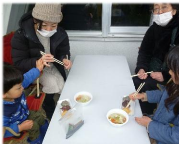
「つきたてのおもちは最高です。」 「わたしは、きなこがいいな。」