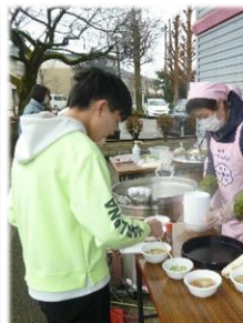
天下一品の豚汁 「具たくさんで！」