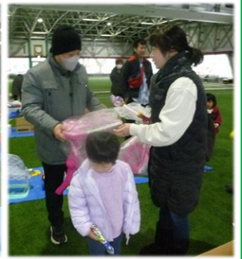
「まだまだ使えるよね!」