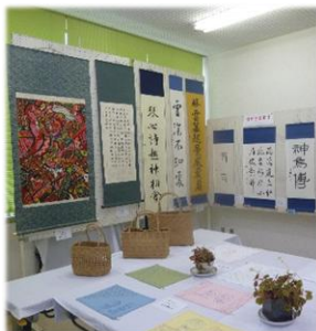
趣味の域を超えている作品