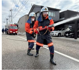
令和7年3月9日(日)に行った福野地域消防団・井波消防団連合同春季訓練

防火水槽の場所や地域の道路・住宅事情などを熟知し、火災や自然災害が発生したときには自宅や職場から現場へ駆けつけ、適切な消火・救助活動を行うのが消防団員です。