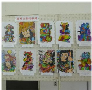
作品展示 園児の武者絵

ご来場いただいた多くの方々、そして、このイベントにご協力くださった方々に心からお礼申し上げます。