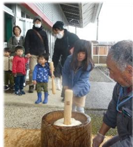
もちつき大会 「おいしくなあれ！」