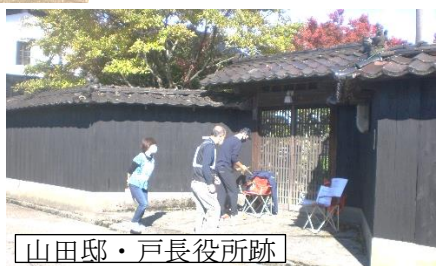
山田邸・戸長役所跡