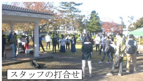
スタッフの打合せ

また、食生活改善推進員、生涯学習推進委員、ひとづくり部会の方々（40名）には、スタッフとして協力していただき、ありがとうございました。