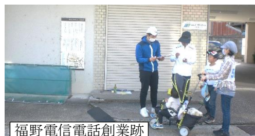
福野電信電話創業跡